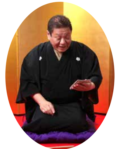
ようやく当たった事を実感し、腰をぬかす