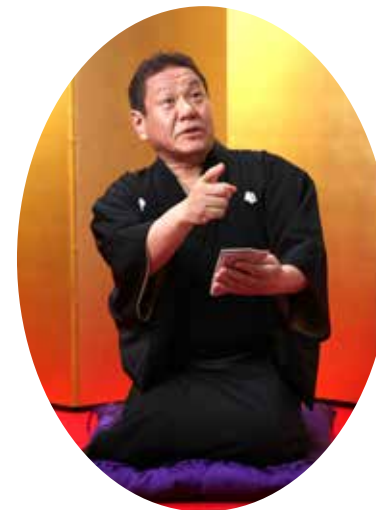
次第に指が震え声が出なくなって、絶句