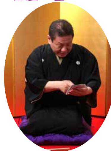
子の千三百六十八番の自分の札と当たり番号を交互に指さして