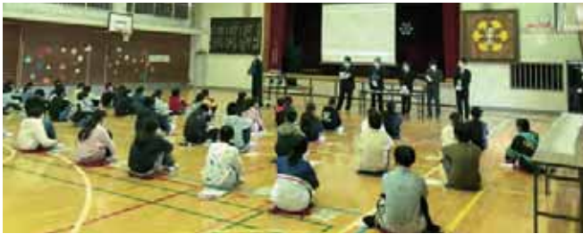
12/8 上尾市立上平北小学校 租税教室