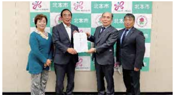
11/27 北本市 市長