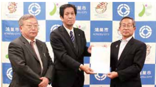
12/11 鴻巣市 市長