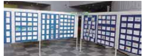
10月2~3日の展示会の様子