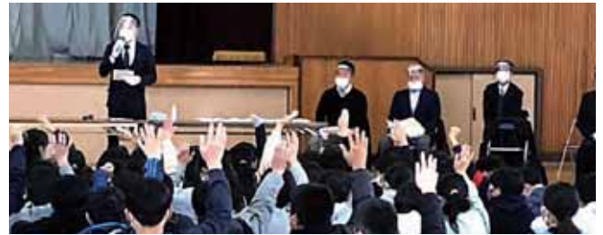
12/17 鴻巣市立吹上小学校 租税教室