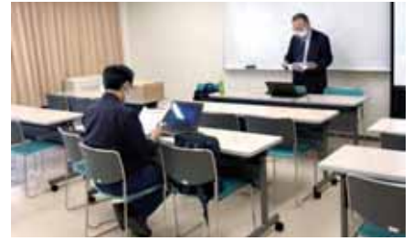
10/27パソコンセミナー(アクセス中級)