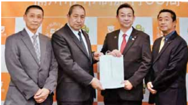
11/24 桶川市 市長