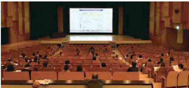
11/25 年末調整説明会 上尾市文化センター 大ホール