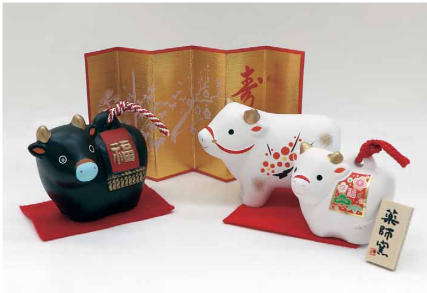
干支人形提供：広田屋様