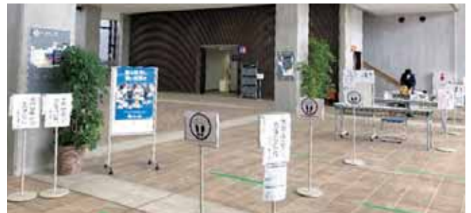
11/25 年末調整説明会 受付の様子 上尾市文化センター 大ホールロビー