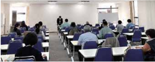
11/17 在職高齢年金のしくみ研修会