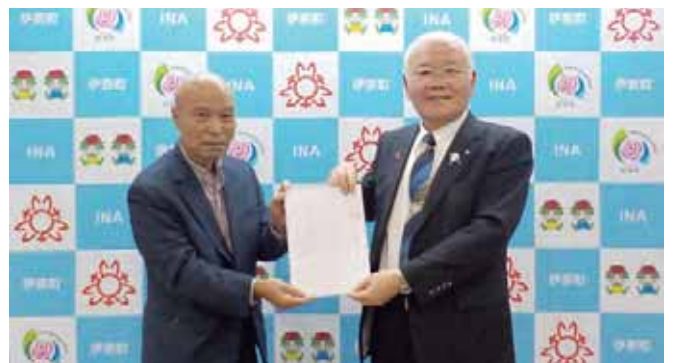
11/20 伊奈町 町長