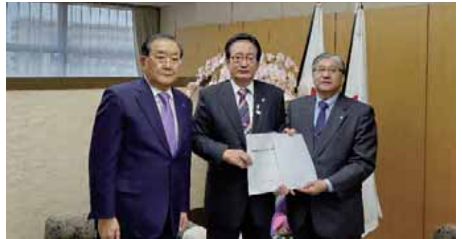
11/25 上尾市 市長