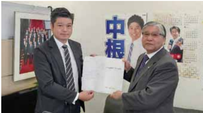
11/30 中根一幸 衆議院議員