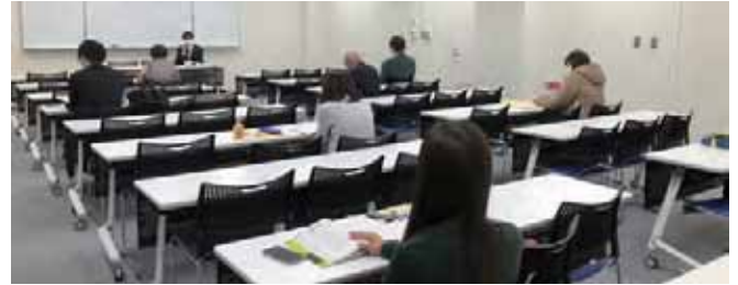
12/3 法人税申告実務研修会