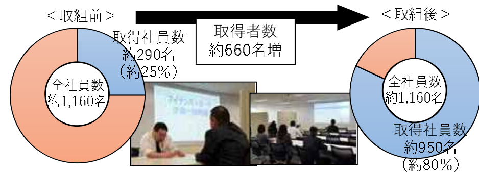
C社のマイナンバーカード取得状況