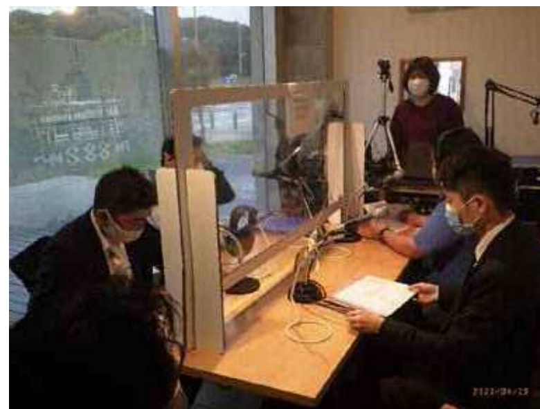
<FMラジオ番組「明日への扉」>