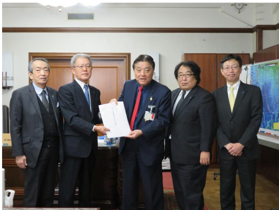
H29. 12. 13 市長室にて、名古屋市長 河村たかし氏へ提言書を手渡し