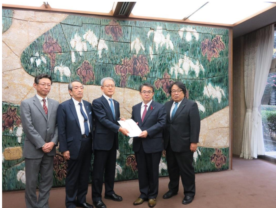
H29. 12. 1 愛知県公館にて、愛知県知事 大村秀章氏へ提言書を手渡し