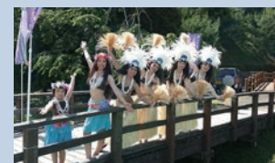
タヒチアンダンス