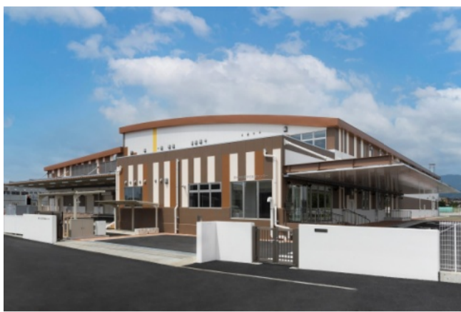
▲厚木市北部学校給食センター（写真提供/厚木市）

調理能力は1日最大7000食の供給能力を持ち、厚木市内全中学校13校に供給しています。同センターの主な特徴としては、文部科学省『学校給食衛生管理基準』および『HACCP（注2）』基準に適合した衛生管理の徹底があります。具体的には、①細菌の増殖を防ぐため、床を乾いた状態にするドライ