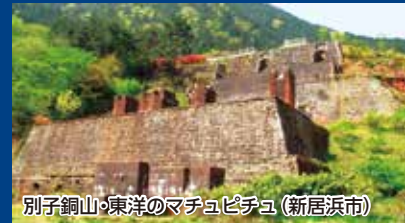
別子銅山・東洋のマチュピチュ (新居浜市)