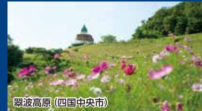
翠波高原 (四国中央市)