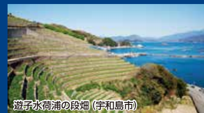
遊子水荷浦の段畑 (宇和島市)