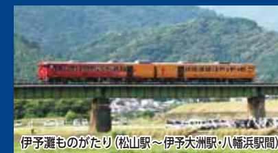
伊予灘ものがたり (松山駅～伊予大洲駅・八幡浜駅間)