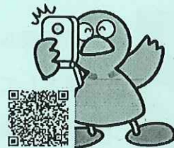
埼玉県マスコット「コバトン」