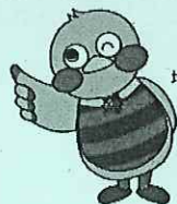
埼玉県マスコット「さいたまっち」

URL http://www.pref.saitama.lg.jp/a0808/rodoseminar/index.html