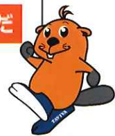
VIVAぎょうだマスコット タビーパーくん

主催: 埼玉県 共催: 行田市 企画・運営: 一般社団法人さいたまキャリア教育センター (事業受託団体)