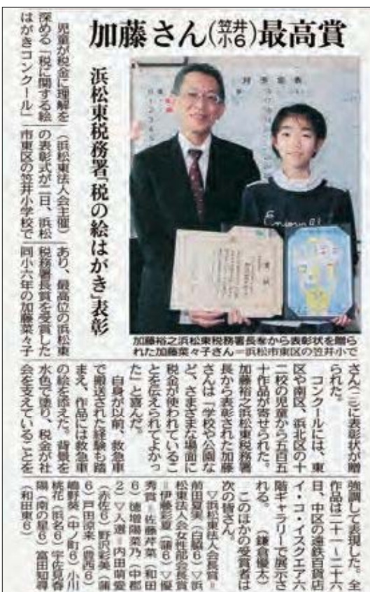
中日新聞 3月3日 朝刊