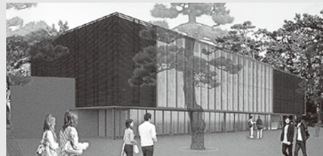
静岡市三保松原文化創造センター

未来に向けて、美しい松原を守りながら、文化創造の道しるべとなるように、この意味が込められています。