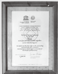
登録証明書 静岡市

2013年6月の第37回世界遺産委員会において、「富士山—信仰の対象と芸術の源泉—」の名称で世界文化遺産に「文化遺産」として登録されました。