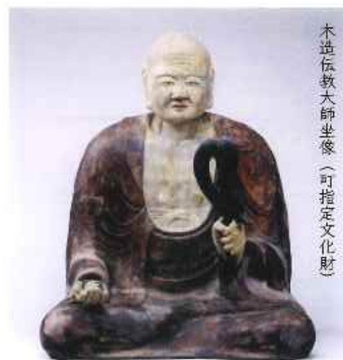
木造伝教大師坐像(可指定文化財)

現存する十一面観音立像は、県の彫刻文化財指定第1号。秘仏として毎年4月の第1日曜日に御開帳となり、美しいしだれ桜のある境内では地元の方々による狂食のお接待や子供会の花祭り、奉納相撲などが行われ、県内外からも多くの方が訪れています。