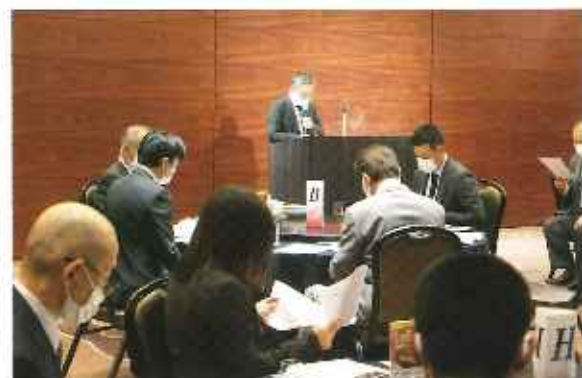
△組織・厚生合同委員会

令和3年11月29日(月) 県連会議室 五法人会税制委員会 福岡市内五法人会の委員で令和5年度税制改正要望事項を検討しました。