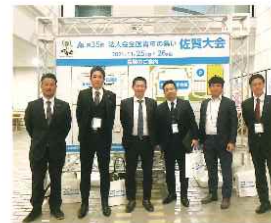
△全国青年の集い 佐賀大会