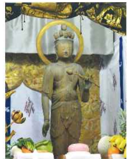
木造十一面観音立像(県指定有形文化財)

頭上にある11個の蓮にはそれぞれ意味があり、また、当初は全身漆塗りの像であったようです。