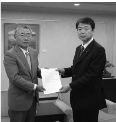
永田広島市議会議長へ提出