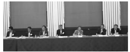
三者連絡協議会のもよう 〈支部委員会〉