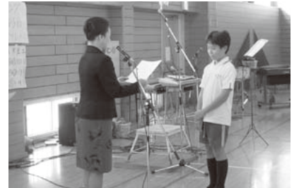
広島三育学院小学校