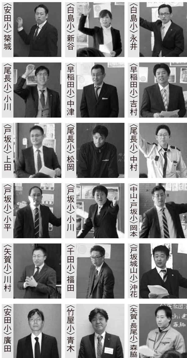
〈 〉内は開催小学校 ※講師敬称略

租税教室とは、小学6年生を対象に、青年部会会員が講師として教壇に上がり、税金の意義や役割について理解を進める授業を行うものです。今年度は、管内12の小学校28クラス910名に対して開催いたしました（台風により中