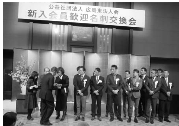
新入会員の皆さん

第2部は新入会員歓迎名刺交換会では、本年度の新入会員214社のうち38社が参加。ステージ一杯の新入会員へ、会員バッジの贈呈の後、自己紹介をして頂きました。懇親の中では会場中で名刺交換が行われ、活気のある異