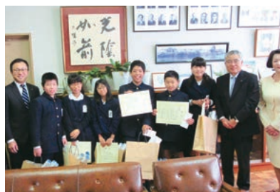
白島小学校(会長賞)