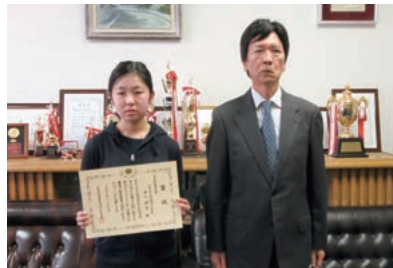
早稲田小学校(広島東税務署長賞)