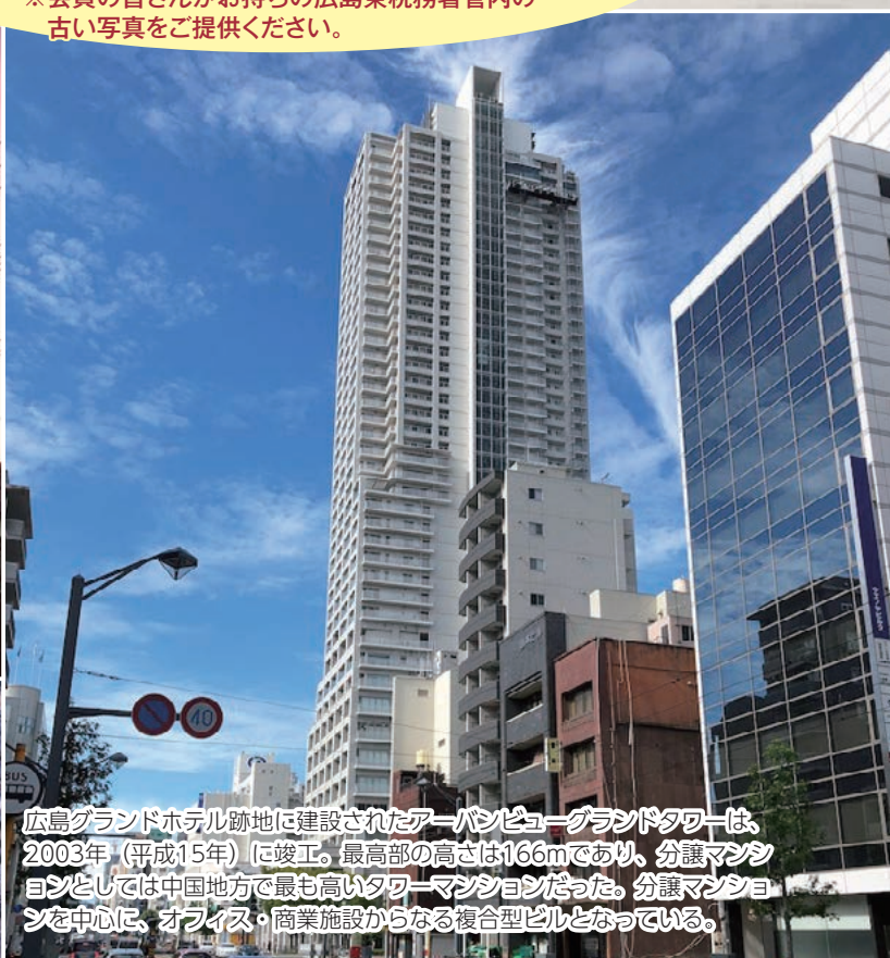
広島グランドホテル跡地に建設されたアーバンビュージェランドタワーは、 2003年(平成15年)に竣工。最高部の高さは166mであり、分譲マンシ ョンとしては中国地方で最も高いタワーマンションだった。分譲マンシ ョンを中心に、オフィス・商業施設からなる複合型ビルとなっている。