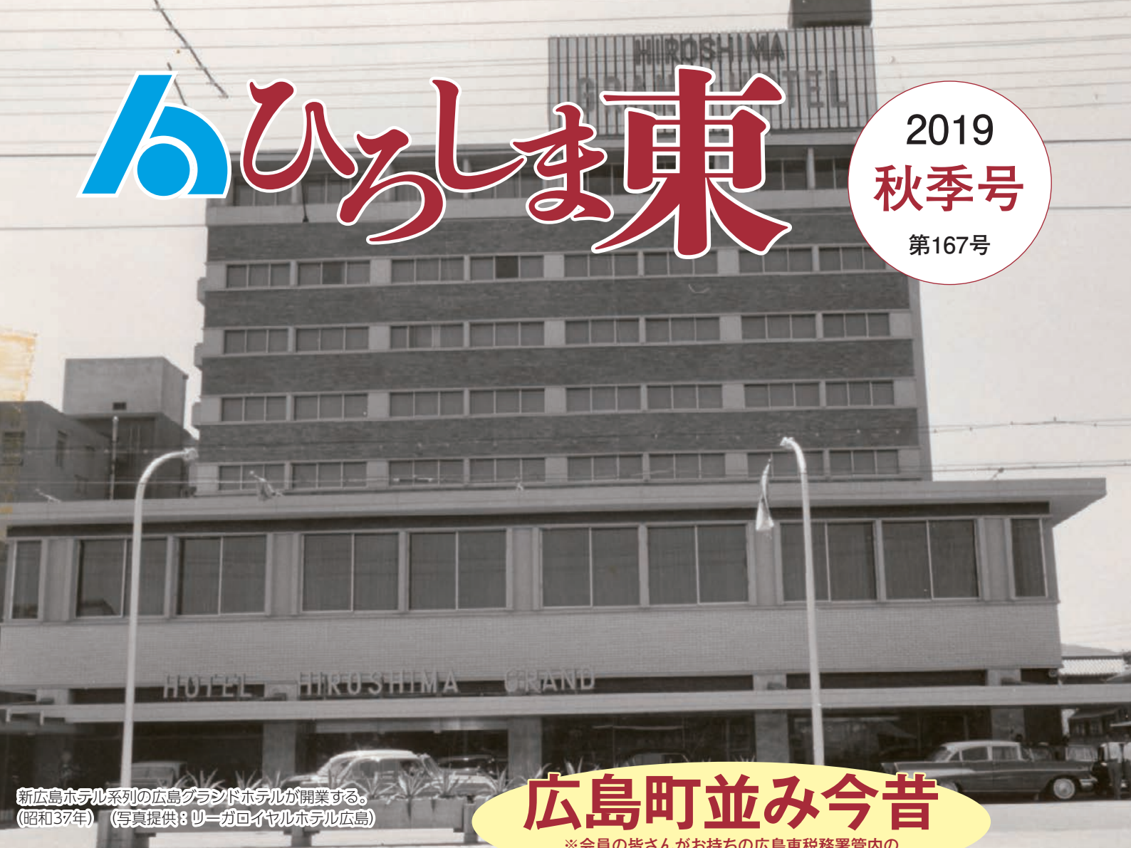
新広島ホテル系列の広島グランドホテルが開業する。 (昭和37年)