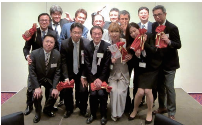
2018年度卒業生の皆様

う、Find! 広島東法人会」が確認され、地域社会に貢献できる活動として「租税教室」の実施、一般の方も共に学べる「青年経営者勉強会」、「講師例会」の企画、実施など公益活動を中心に取り組む。