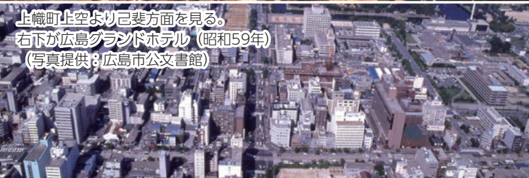
上機町上空より巨斐方面を見る。 右下が広島グランドホテル (昭和59年)