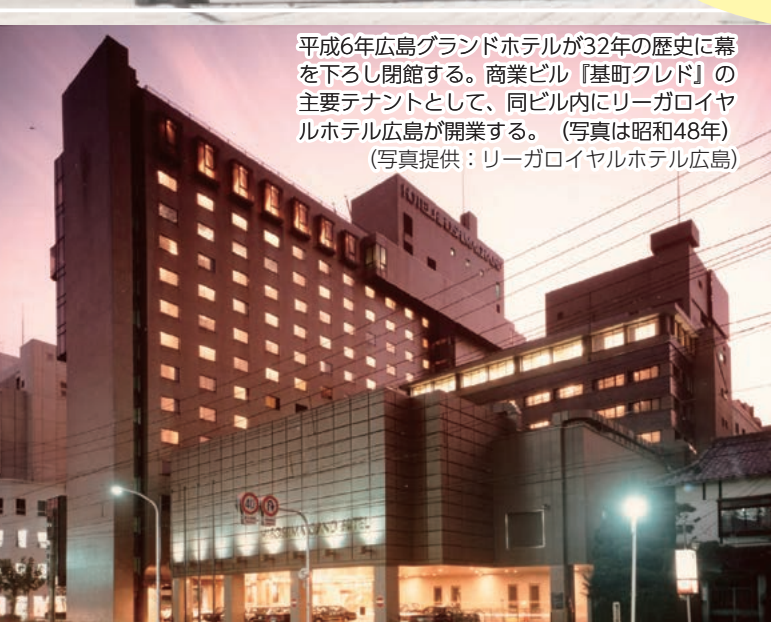
平成6年広島グランドホテルが32年の歴史に幕 を下ろし閉館する。商業ビル『基町クレド』の 主要テナントとして、同ビル内にリーガロイヤ ルホテル広島が開業する。(写真は昭和48年)