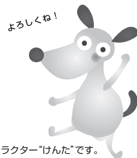
法人会オリジナルキャラクター“けんた”です。

※今治法人会ホームページ インターネットアドレス http://hojinkai.zenkokuhojinkai.or.jp/imabari/