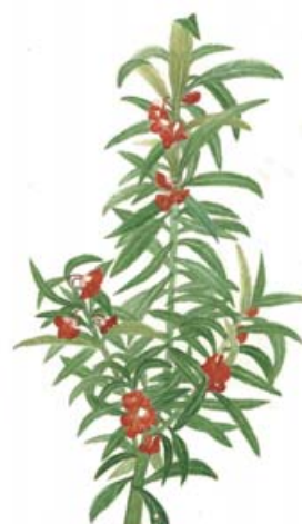
イラスト 河野 幸子（広報委員）

午後2：00より 於：神奈川県トラック会館 ■テーマ「毎月の給与と賞与」～月々の源泉徴収事務～ 講師 神奈川税務署法人課税 第三部門 堀上席国税調査官 参加人数 53名