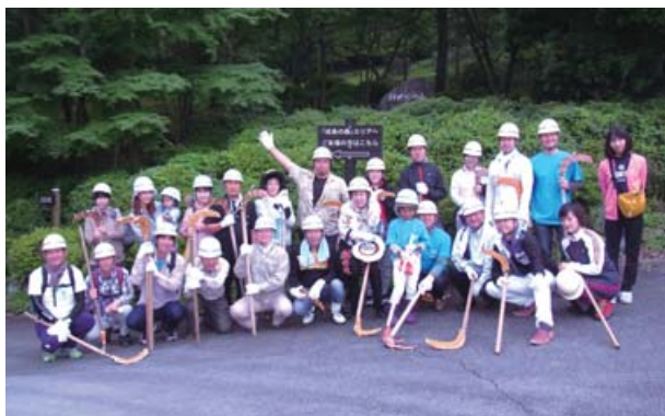
10時30分より 於：県立21世紀の森 参加人数(当会より) 29名 今年度よりヤビツ峠法人会の森から県立21世紀の森に場所を移動して木を育てていきます。