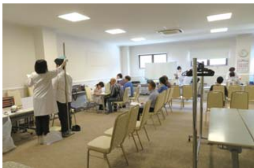
於：加瀬倉庫・神奈川公会堂