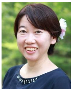
小野税務会計事務所 所長 税理士