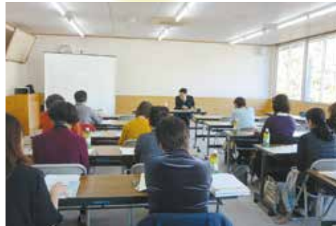
ブロック別税務研修会