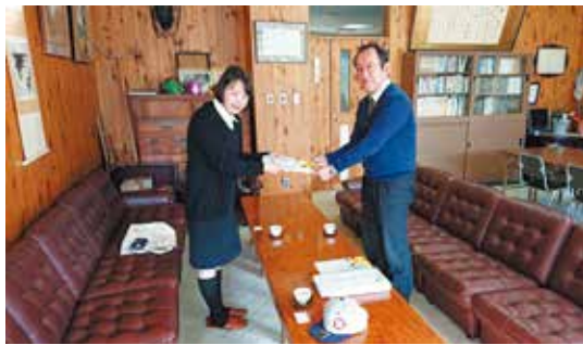
募集依頼をする 木祖村支部女性部副部長（木祖小学校）

作品が集まったところで関係者によって選考会を行い、最優秀作品については、長野県連を通じて、全法連の審査会の対象作品として出展します。この事業は、租税教育事業・地域社会貢献事業として、毎年継続してまいります。