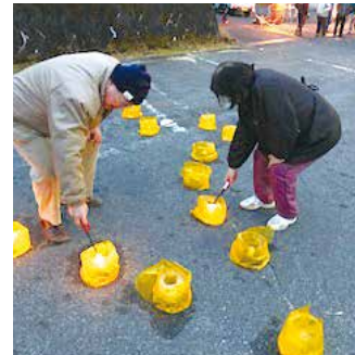
1月25日 氷雪の灯祭り 支部会員ボランティア作業