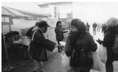
白坪支部：田崎市場感謝祭