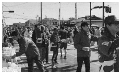
飽田支部：熊本城マラソン応援 地域交流