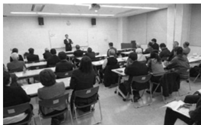
上益城郡合同：研修会