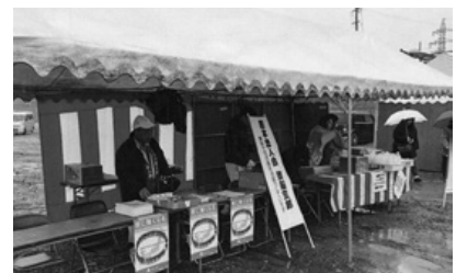
御船町支部：商工感謝祭