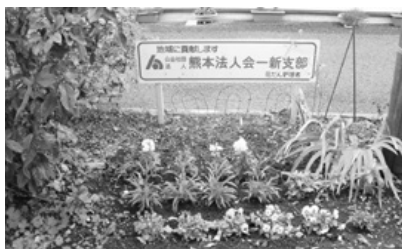
一新支部：花植え運動