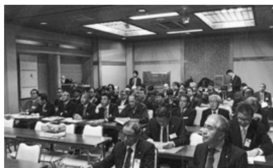
御船町支部：賀詞交歓会・講演会