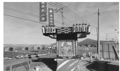
天明支部：熊本城マラソン応援 震災復興神輿展示