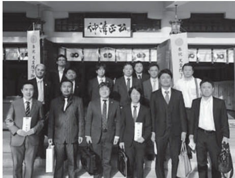
厄入り厄晴れ祈願