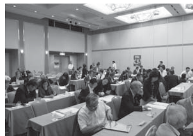
大同生命保険推進担当者 と支部長との情報交換