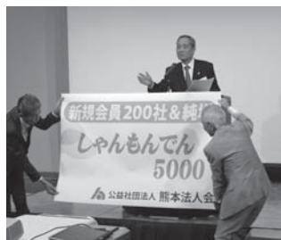
松本組織委員長により 「しゃんもんでん5,000」運動の説明