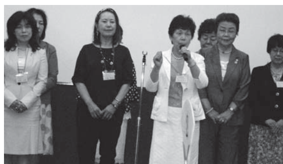
涇田新部会長挨拶