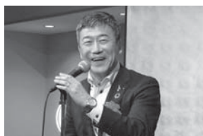
大同生命保険 廣中本部長の挨拶