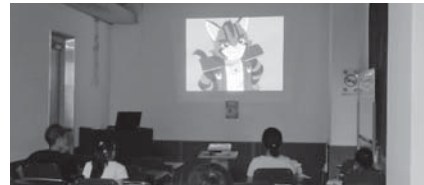
税のアニメ上映会