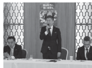
大同生命 廣中支社長の挨拶