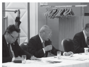
門垣監事の監査報告