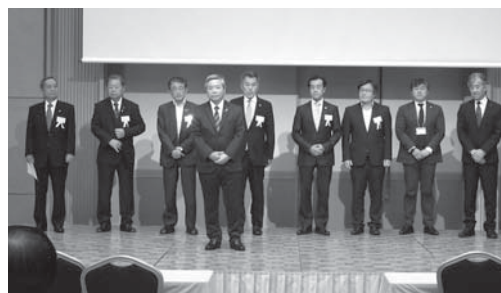
令和元年度執行役員