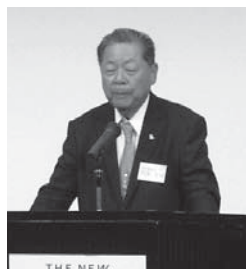
住永厚生委員長の挨拶