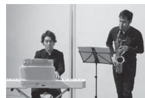
サクソとピアノの 演奏