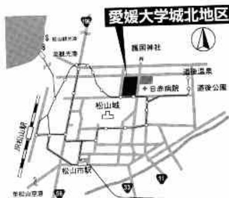
愛媛大学城北地区