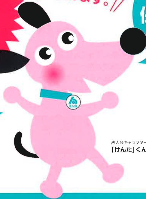
法人会キャラクター 「けんた」くん