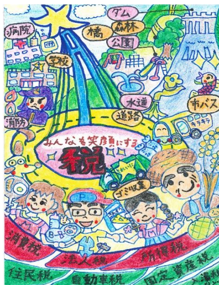
《 最優秀賞 滝川地方法人会 》