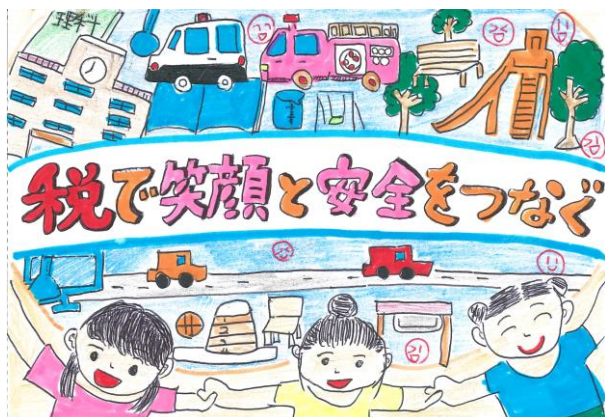
《 優秀賞 札幌西法人会 》