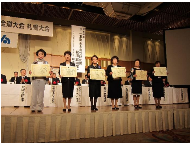
絵はがきコンクール受賞会の皆様