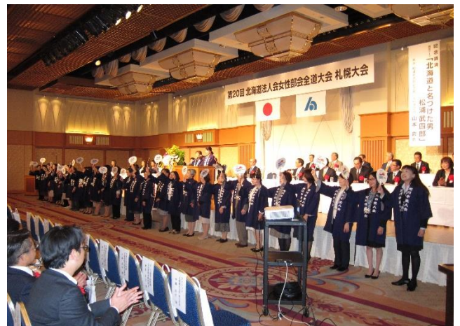
次回開催地会挨拶 旭川中・東法人会