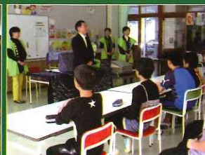
租税教室 樋田小学校