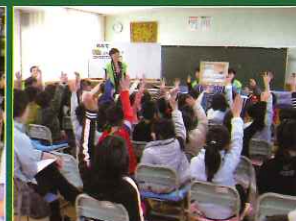
租税教室 和間小学校