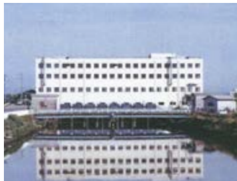
初代親松排水機場

その機場も30年以上が経過し設備の老朽化、機場の不等沈下などにより排水機能の維持が困難となったことから、二代目親松排水機場が平成19年に完成しました。