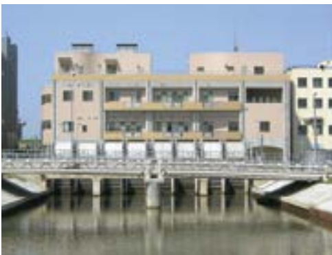
二代目親松排水機場

■ 排水機場登場 しかし、昭和23年に、農林水産省の国営阿賀野川農業水利事業による当時東洋一を誇った栗ノ木排水機場が現在の紫竹山インター付近に完成したことにより、鳥屋野潟の水位が約90cmも下がり、農耕牛馬の利用が可能となりました。