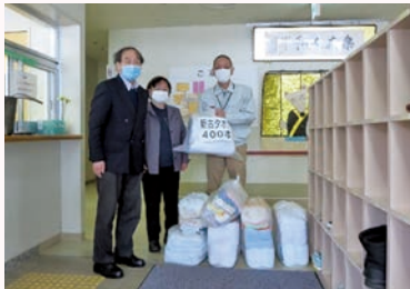
きりん荘 (阿賀町) タオル400本