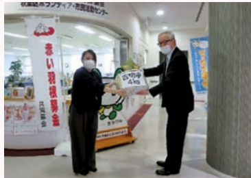
秋葉区社会福祉協議会 古切手 4 kg

「法人税・消費税申告説明会」、 「社会貢献講演会」の受講者様、 講師の伊勢みずほ様、「たなば たコンサート」参加者様からた くさんのご協力を戴きました。 ありがとうございました。