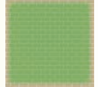
独自工法(全域接着)