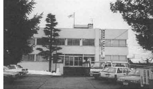
《写真：昭和移転当時の税務署》

明治 29 年 11 月 1 日 小千谷税務署設置 大正 13 年 11 月 1 日 六日町税務署を合併 昭和 41 年 1 月 26 日 現在地へ移転