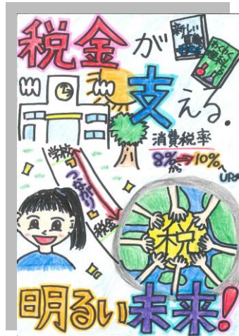
興儀華夢(伊良部島小)