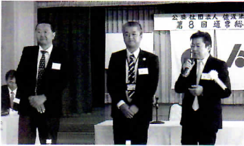
新会長および新副会長