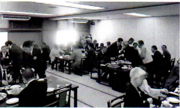
総会懇親会 63名参加