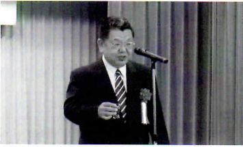
須田先生による乾杯