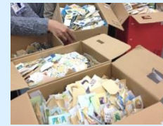
使用済み切手収集