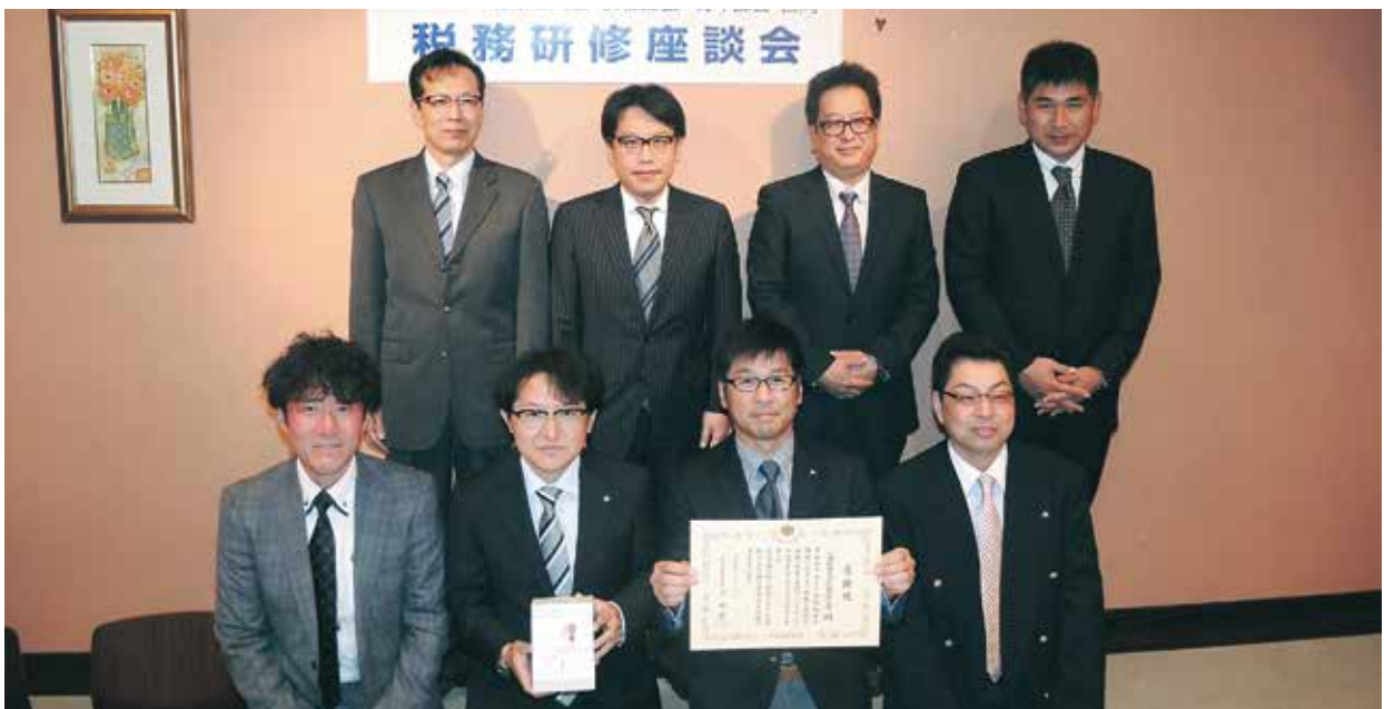
座談会へ出席の青年部のみなさん

○ (11/12) 税務座談会 〈青年部会〉 庄原市内で、税務署長と税務座談会実施。