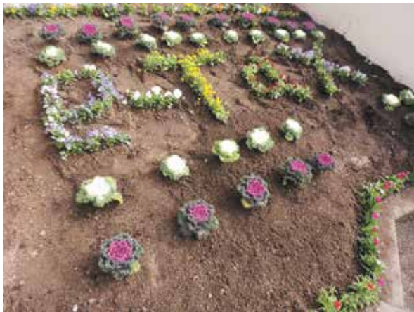
11月6日 税務署入口を「e-Tax」の花文字で飾った

（11/6）庄原税務署周辺で、税務署長他幹部職員、会長・副会長・広報委員・女性部役員等とで、税広報標語入りプランターなどに年末・初春用の花植え実施。