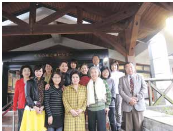
税務研修交流会親睦会参加の皆さん