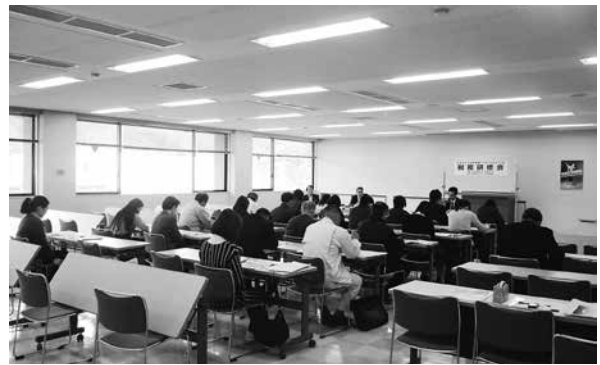
東城会場で研修中のみなさん

○(11/6) 税務座談会 庄原税務署で、税務署長・統括官、会長・副会長・広報委員・女性部役員とで税務座談会、併せて税広報用花植えを実施。(9名)