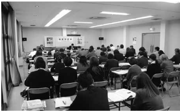
庄原会場で研修中のみなさん