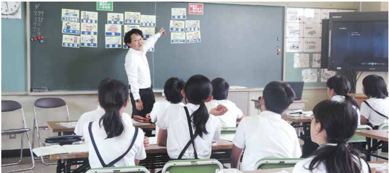
税金の仕組みなどを児童に教える今岡副部長

○ (11/12) 税務座談会 〈青年部会〉 庄原市内で、税務署長と税務座談会実施。