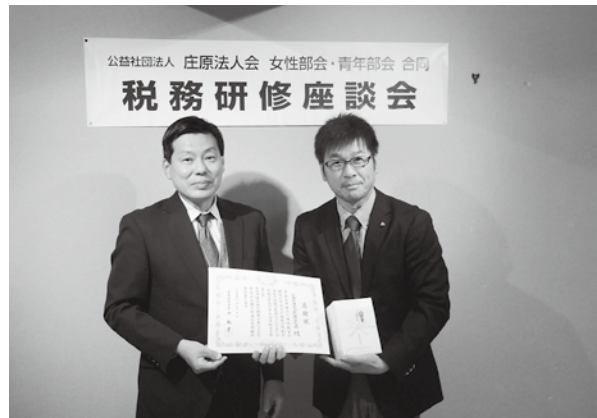
中税務署長(左)と貞入青年部会長