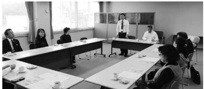
11月6日 税務座談会で講話中の中税務署長(中)と参加のみなさん