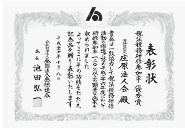
平成27年10月8日 税法税務研修参加率優秀賞