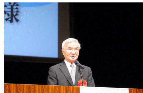
道法連中井会長祝辞