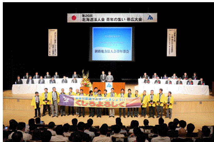
次回開催地挨拶 釧路地方法人会青年部会