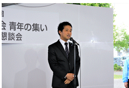
全国法人会総連合 中村青連協会長挨拶