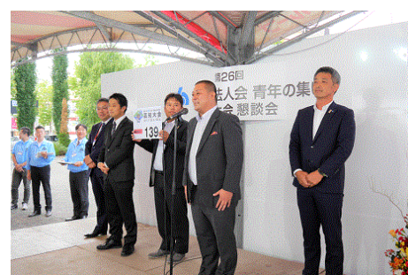
高知大会 P R