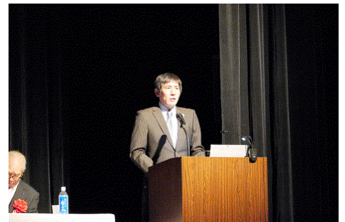
鹿屋肝属法人会（熊本県連） 租税教育活動事例発表