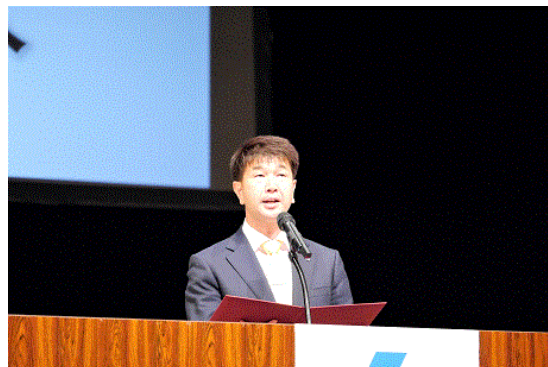
大会宣言 朴大会実行委員長

平成28年9月、第30回法人会全国青年の集い北海道大会が開催されました。「Be Ambitious! Do Action!」をスローガンに掲げ、全国から集った部会員が、法人会青年部会として崇高な志を持って租税教育活動を実施していくことを、旭川の地で宣言致しました。