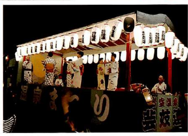
<<岩室温泉芸妓屋台踊り>>