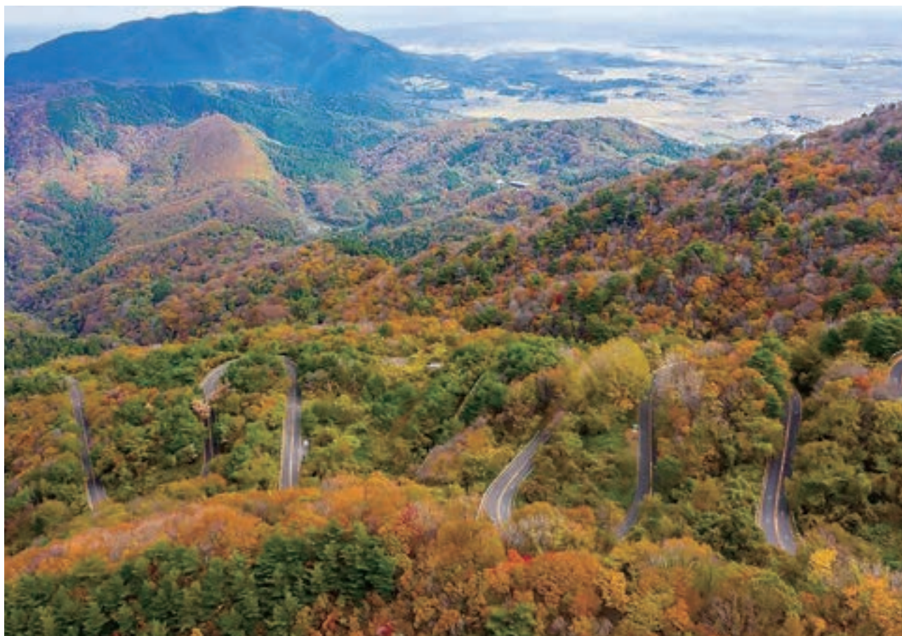
『紅葉だいろ坂』（2020巻・岩室温泉郷観光写真コンテスト 最優秀賞 樋口 廣治 様）

発行所 公益社団法人 燕西蒲法人会 燕市東太田6856番地 TEL 0256-64-2115