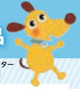
法人会キャラクター 「けんた君」