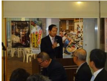
清家会長からの挨拶