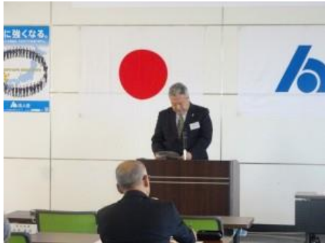
税務署長からの挨拶