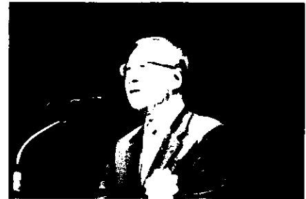
税制改正提言実現状況説明(宇賀副会長)