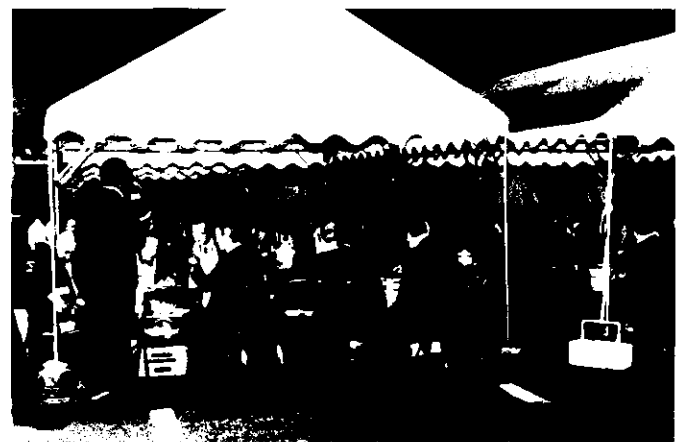
大賑わいの屋外焼肉会場