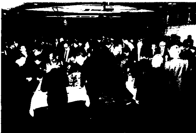
懇談会風景(ホテル黒部)