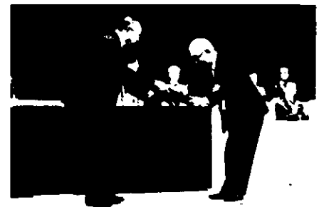
大会楯伝達 (北見太布会長から帯広高橋会長へ)