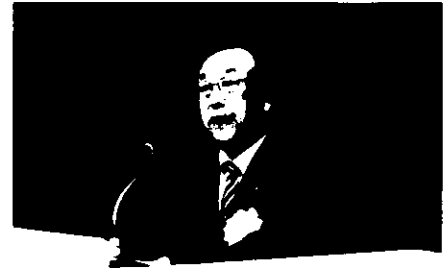
議長を務める北見地方法人会太布会長