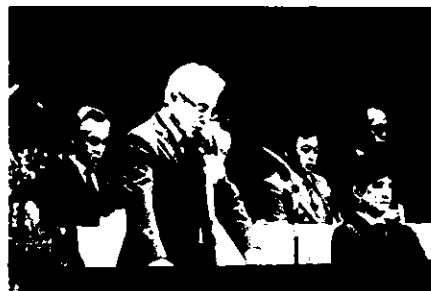
大会決議朗読(三品副会長)