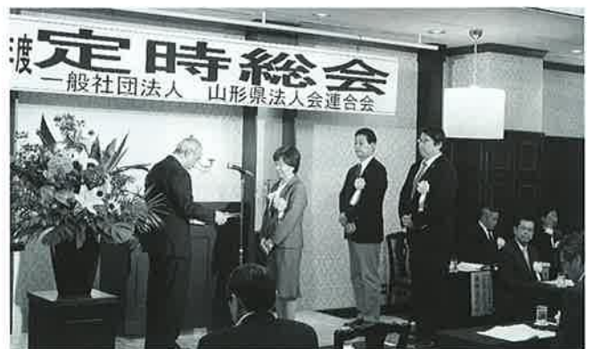
県連表彰 役員功労者表彰受賞者