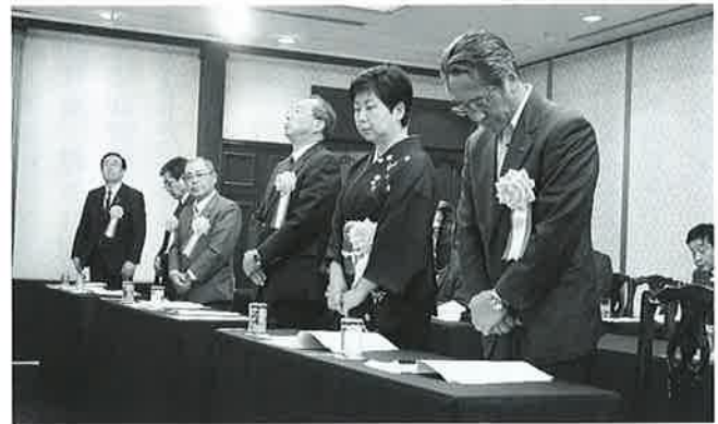
全法連表彰受賞者

法人会会員企業にお勤めの皆様は、お一人からでも集団取扱の割安な保険料でご加入いただけます。