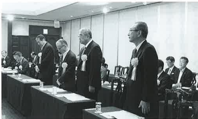
東北連表彰受賞者