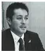
【プロフィール】 ファイナンシャルサポーター

コラムの内容について、その他お問い合わせは『090-2028-6299』(直通)またはLINEアプリで『@ASR2448L』を検索してください!お気軽にどうぞ!