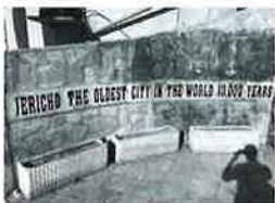
パレスチナ東部のエリコ。世界最古で世界で最も標高が低い街。

これは「乗り継ぎ」や「短時間だけ日本を観光する」外国人がほとんどで日本人はあまり関係ないです。 ・二歳未満の人。 ・乗務員や外交官、領事館員など。 基本的に免除はないと思つた方が良さそうです。