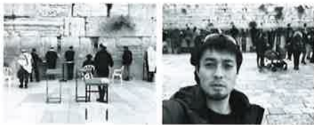
嘆きの壁。ユダヤ教徒にとって神聖な場所とされる。