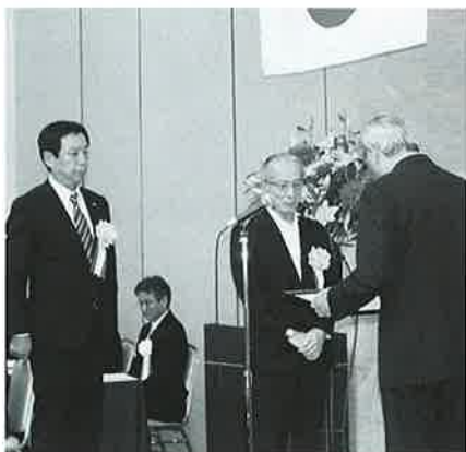
会員増強優秀法人会 (米沢法人会・酒田法人会)