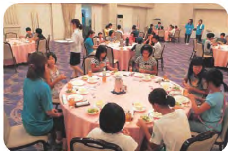
昼食後は税金クイズ