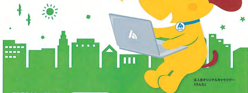
法人会オリジナルキャラクター 「けんた」

「e-Tax」なら国税に関する申告や 納税、申請・届出などの手続きが インターネットで行えます。