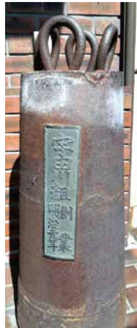
モンケン（ヨイトマケの際に使ったおもりです）

税務署と法人会が協力してノウハウを共有する中で、一緒に法人会を盛り上げていくことが必要かと思えます。そのためにも、会員数の増加と、活動に対する会員の皆さんの協力が必要になりますので、よろしくをお願いします。