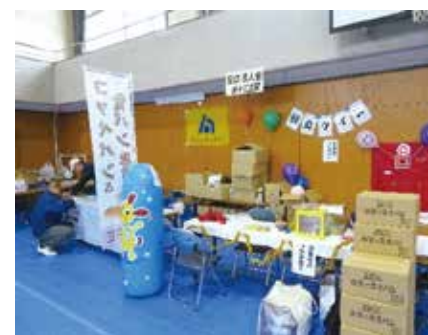
「あしの芽祭」での法人会活動

20年ほど前に十三中学校のPTAをしていた頃、生徒、教師、地域が繋がる何かはないかと考えた結果できたのが「あしの芽祭」というイベントになります。