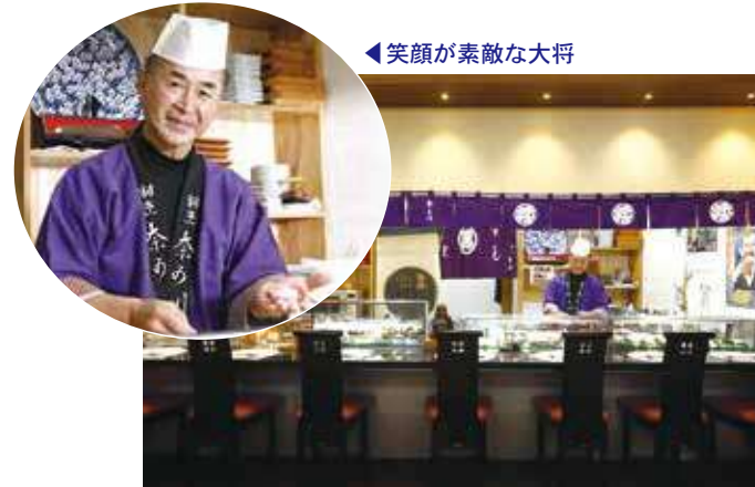
◀笑顔が素敵な大将