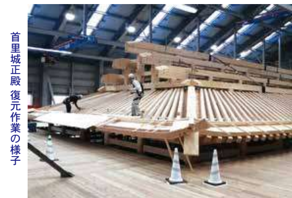
首里城正殿復元作業の様子

那覇空港に降り立ち、最初の研修先として2019年の火災により正殿が消失し、復元作業の真っ最中にある首里城を訪問いたしました。専属の地元ガイドさんと共に復元中である今しか見れない作業現場を見学することができ、非常に貴重な体験となりました。