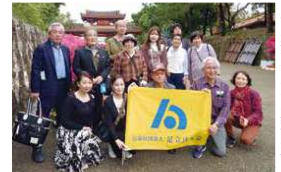
首里城守礼門前での集合写真

2日目は、沖縄を代表する一大観光スポットの美ら海水族館へ。館内は平日にもかかわらず修学旅行生やインバウンド客で混雑していましたが、ジンベイザメを真下から見上げることが