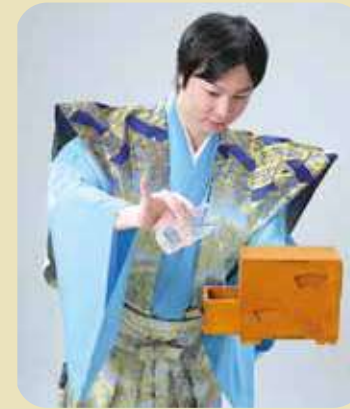
空引き出しに水を注ぎます。

お染久松通いの鞆とも申します手品で仕掛けがとても良くできています。箱に入れた鞆が消えたり出たり、最後は紅白のだんだらが出て傘が一本出てくるという華やかな日本手品です。日本手品特有の雰囲気も残し、私のお気に入りの演目でもあります。一昔前は帰天齋派の御家芸として大変貴重な芸とされ扱われてきました。現在でも演じる方は多くありません。