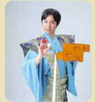
紅白の鞆を引き出しにいとそれが消え、袂から出て来ます。また袂へ入れると引き出しに通ります。