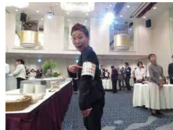
食品ロス削減お願いします