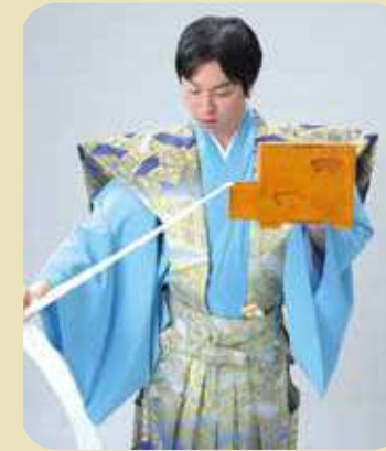
あら不思議？濡れていない紙テープが出現します。