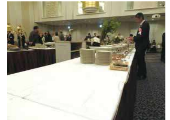
みんなで綺麗にいただきました