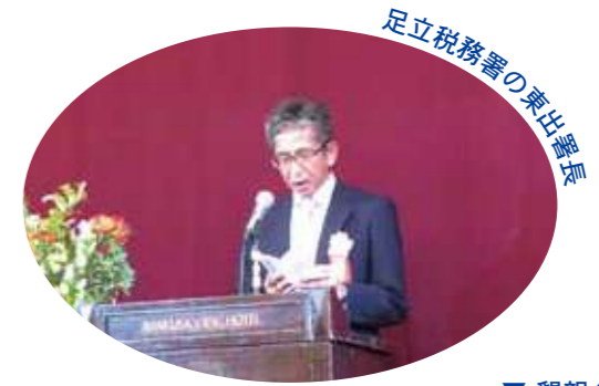
足立税務署の東出署長