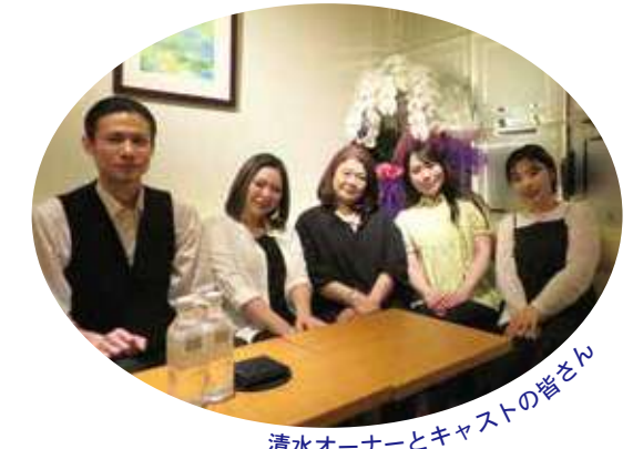
清水オーナーとキャストの皆さん

私が足立区出身ということで地元竹の塚にミニクラブ「Little Garden」を2020年にオープンしました。当時はコロナ禍の真っ只中ということもあり、オープンできず営業自粛を余儀なく