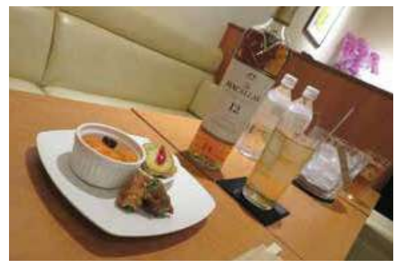
チーママ特製お通し

された状態が続いてました。しかし、私を法人会・青年部会に紹介して下さった古庄支部長をはじめ、ご最真にいただいている常連のお客様の温かいご支援があり、営業を続けることができました。