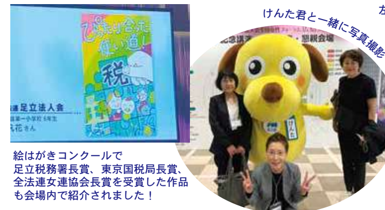
絵はがきコンクールで足立税務署長賞、東京国税局長賞、全法連女連協会会長賞を受賞した作品も会場内で紹介されました！