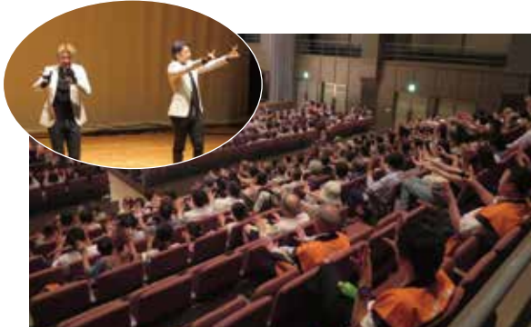
XTRAPさんと一緒に手を動かしましたが、これが難しい!

まず初めにご登壇していただいたのは「XTRAP」!フィンガーパフォーマンスの一部を来場者全員に教えていただき、実際に手を動かしてみました。想像以上に難しくそのパフォーマンスの高さを肌で感じることができました。