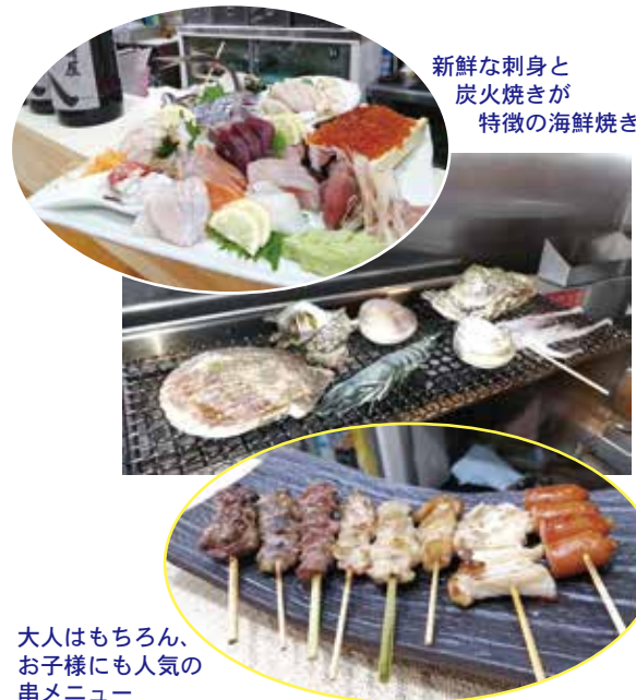
新鮮な刺身と炭火焼きが特徴の海鮮焼き

当店のこだわりとしては、新鮮で旬な刺身、海鮮焼きといった魚料理や焼き鳥などの定番メニューがお手頃価格で味わえる点で、お子様連れのお客様にも多くご来店いただいております。