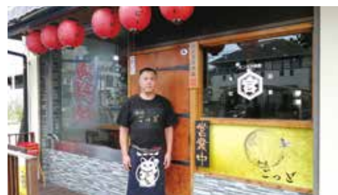
皆さまのご来店、心よりお待ちしております！

私の自宅からも近く、趣味のサイクリングで疲れた体を癒すには最高の場所です！新鮮で美味しい刺身とお酒が最高なので、皆さまもぜひ味わっていただきたいです！