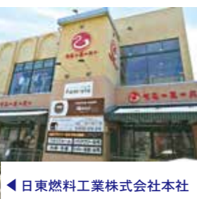
◀ 日東燃料工業株式会社本社