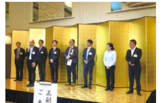
新入会員紹介の様子