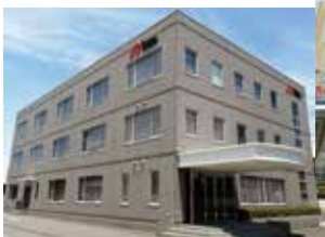
ベニースーパー佐野店 ▶

その中で今ご紹介するベニースーパーは、1974年に地域のお客様の強い要望を受けて足立区・葛飾区に開店し、昨年11月に50周年を迎えました。「地域の豊かな暮らしに貢献したい」をモットーに「おいしさ」と「楽しさ」を届ける地域密着型の店舗として、エネルギー部門とともに“安心・安全”を第一に取り組んでいます。