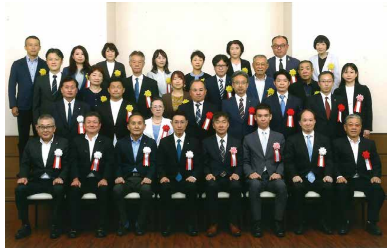
公益社団法人 足立法人会 第15回通常総会 令和8年6月18日 於 浅草ビューホテル