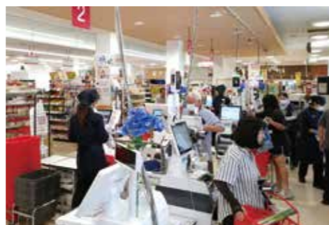
午前中から賑わうスーパーレジ付近