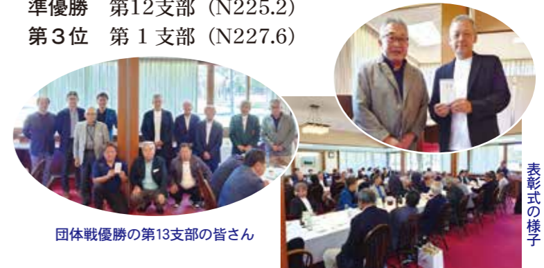
団体戦優勝の第13支部の皆さん