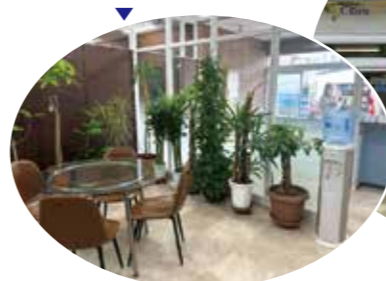
入口を入ってすぐの清々しい応接ルーム

主力のアクアクララ事業は、長年ご愛飲いただき、安定した支持をいただいております。これからも「安心・安全な水」と「楽しく学べるダンス」を通じて、地域の豊かな暮らしに貢献してまいります。