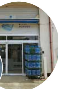
入口につままれたアクアクララボトル